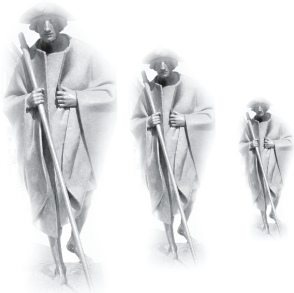
Erstellt von H.W. Hammen, Schornsheim